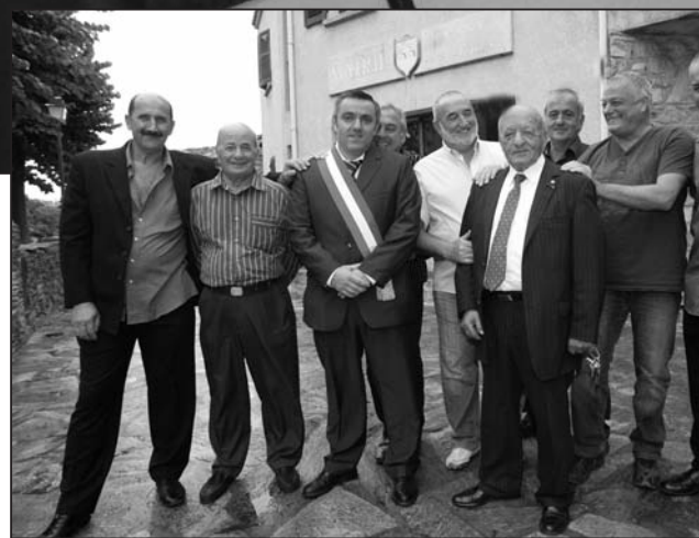
Le maire nouvellement élu entouré de son conseil municipal

dépourvu de commerce et c'est là sa principale lacune. J'ai pour souhait de rendre à la place publique ses lettres de noblesse et ne pas faire de Muchjetu un village dortoir. Pour cela, j'envisage de créer un commerce, sans prétention cela s'entend. Il s'agirait d'un dépôt de pain, une sorte de point presse et relais postal. Un endroit où les gens auraient l'occasion de se rencontrer, d'échanger. Une sorte de « café communal » aux activités élargies. Nous y réfléchissons, mais il est primordial pour moi de redonner aux « Muchjitani » ce lien social.