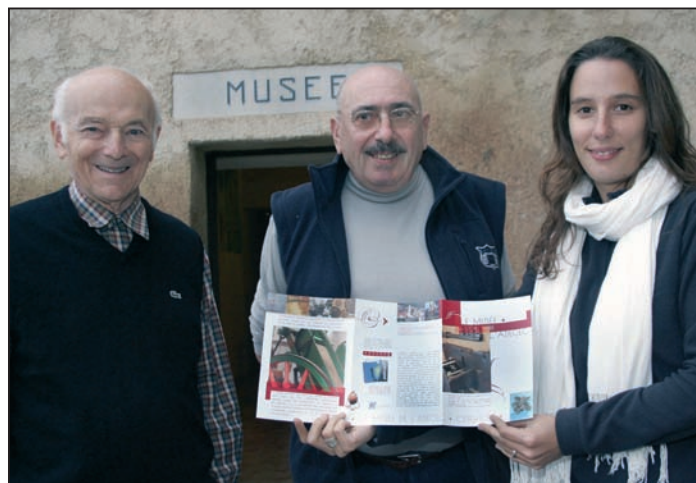
Des guides pour tout public et scolaires : le musée de l'adecec est ouvert toute l'année