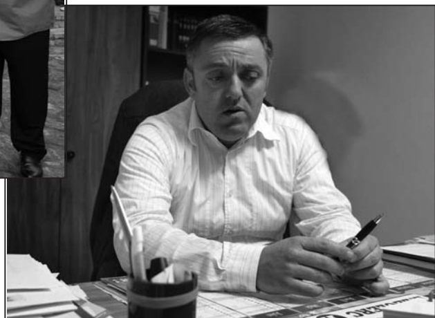
Le confort social de ses administrés est la grande priorité de son mandat