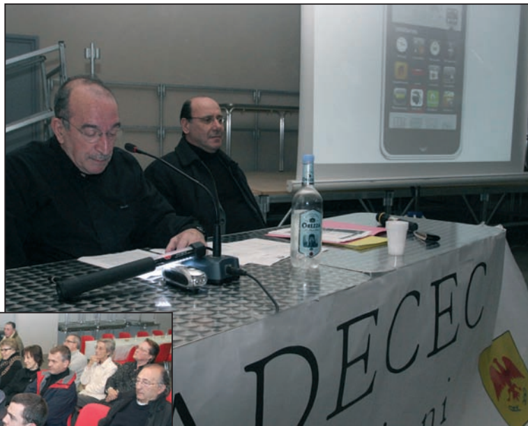
Lors de l'assemblée qui s'est tenue au couvent Saint François de Cervioni

Une langue à laquelle l' Adecec donne la modernité requise, à l'image de sa toute dernière trouvaille : une application Iphone de la banque de données INFCOR !