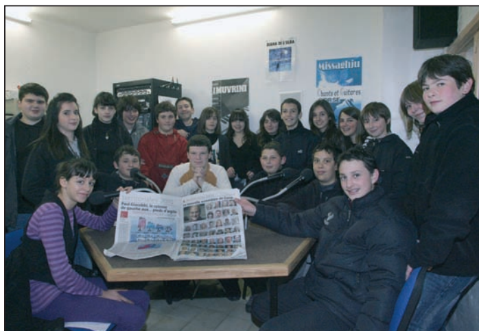
A la radio Voce Nustrale, les collégiens participent tous les ans à la semaine de la presse