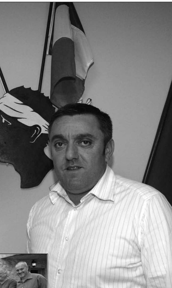
Il est le plus jeune maire élu à Valle di Campuloru