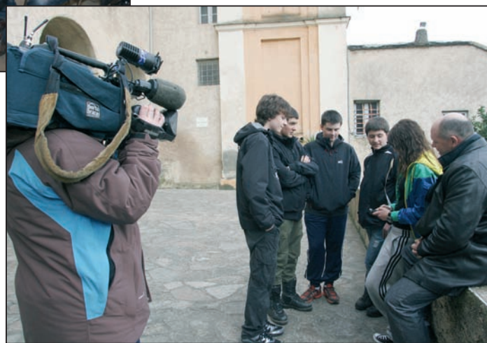
FR3 a consacré un documentaire en langue corse à la nouvelle application Iphone de l'INFCOR